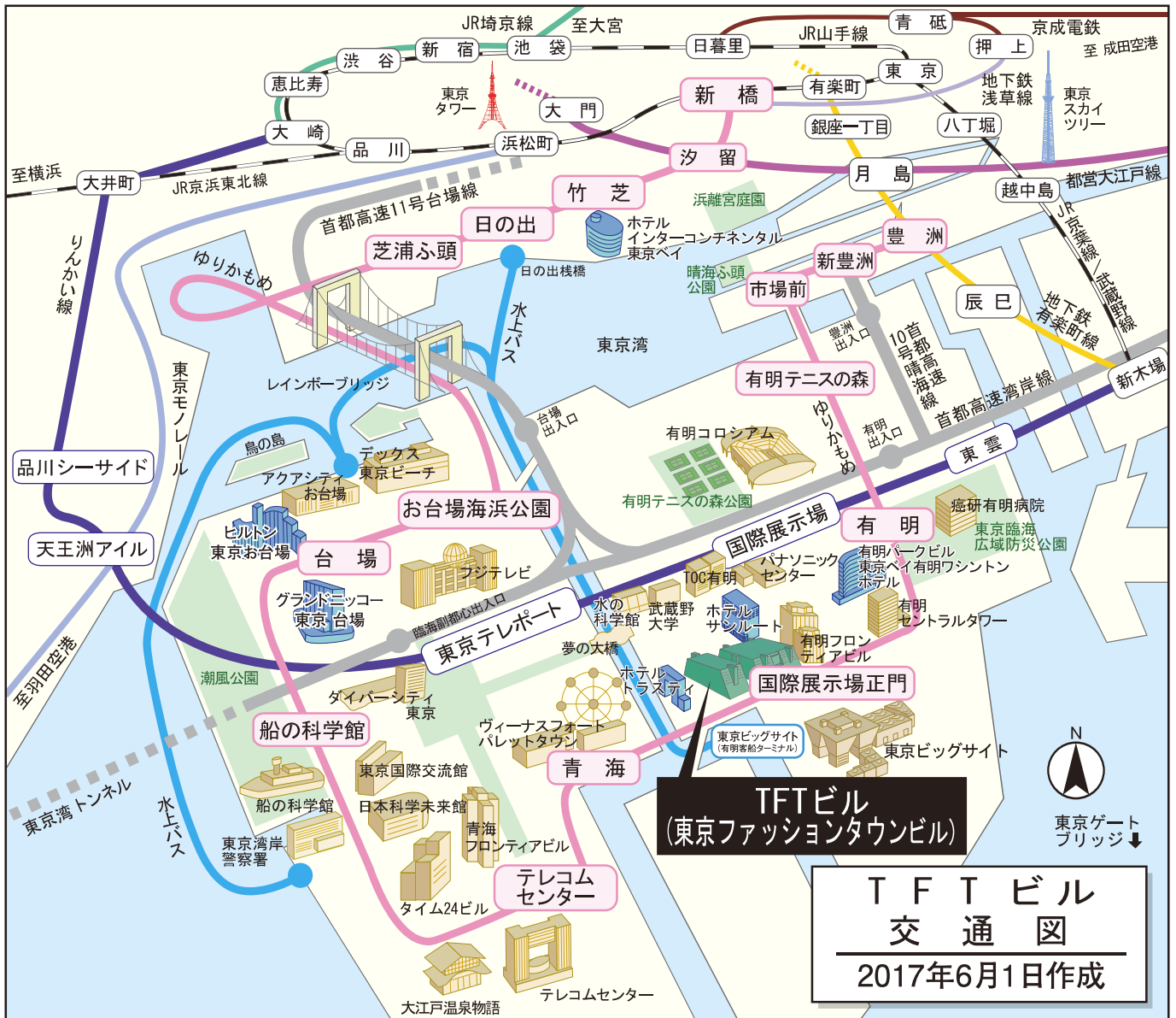
TFTビル 交通図 2017年6月1日作成