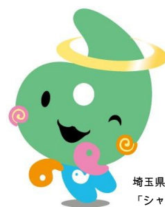
埼玉県社協マスコット 「シャキたまくん」